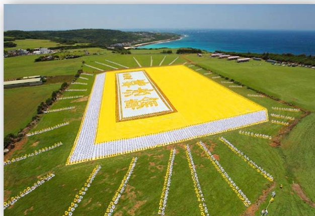
■零九年五月九日，台湾六千余名法轮功学员排《转法轮》颂师恩

所以法轮功学员们不畏生死劝说世人三退，远离危险。为此多少法轮功学员被抓、被打、甚至失去生命……乡亲们啊，现在已有四千九百多万人退出中共党团队。为了自己的未来，不要再迟疑了！