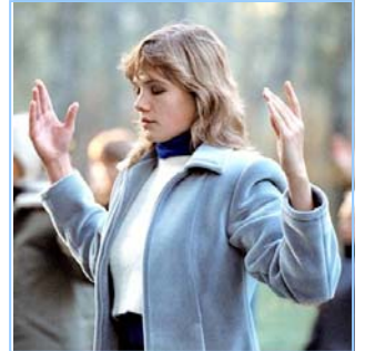
俄罗斯法轮功学员炼功

● 法轮功教人向善 法轮功是佛家修炼大法，以真、善、忍为修炼原则。修炼人从做好人做起，努力按照真、善、忍标准提升个人心性，返本归真；还包含五套缓慢优美的功法动作。法轮大法教人向善。修炼法轮功不但能祛病健身，使人变得诚实、善良、宽容、和平，而且能开启智慧，逐渐达到洞悉人生和宇宙奥秘的自在境界。