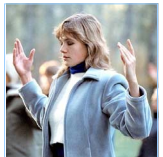
俄罗斯法轮功学员炼功

● 法轮功教人向善 法轮功是佛家修炼大法，以真、善、忍为修炼原则。修炼人从做好人做起，努力按照真、善、忍标准提升个人心性，返本归真；还包含五套缓慢优美的功法动作。法轮大法教人向善。修炼法轮功不但能祛病健身，使人变得诚实、善良、宽容、和平，而且能开启智慧，逐渐达到洞悉人生和宇宙奥秘的自在境界。