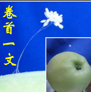
上图：纽约上州，苹果上的优昙婆罗花。