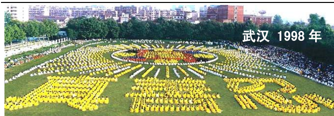
武汉 1998 年

二零零九年九月二十六日晚，亚太人权基金会“人权领袖奖”颁奖典礼在美国洛杉矶鲍温公园市隆重举行，当主持人宣布今年的特殊奖项“杰出精神领袖奖”由法轮功创始人李洪志先生