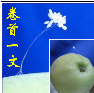
上图：纽约上州，苹果上的优昙婆罗花。