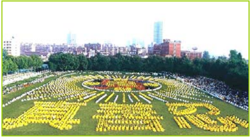
1997年武汉五千多法轮功学员炼功，排组法轮图形和“真善忍”字样

1999年7月20日，中共发动了对法轮功的全面迫害，引发全球法轮功学员反迫害、讲真相活动。◇