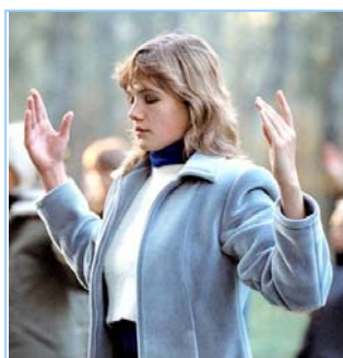
俄罗斯法轮功学员炼功

● 法轮功教人向善 法轮功是佛家修炼大法，以真、善、忍为修炼原则。修炼人从做好人做起，努力按照真、善、忍标准提升个人心性，返本归真；还包含五套缓慢优美的功法动作。法轮大法教人向善。修炼法轮功不但能祛病健身，使人变得诚实、善良、宽容、和平，而且能开启智慧，逐渐达到洞悉人生和宇宙奥秘的自在境界。