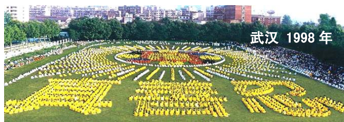
武汉 1998 年