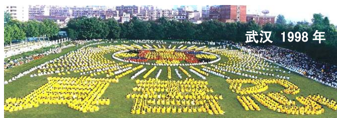
武汉 1998 年

二零零九年九月二十六日晚，亚太人权基金会“人权领袖奖”颁奖典礼在美国洛杉矶鲍温公园市隆重举行，当主持人宣布今年的特殊奖项“杰出精神领袖奖”由法轮功创始人李洪志先生