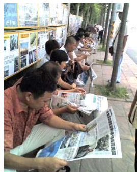
■在台湾景点高雄西子湾的真相看板前，成列的大陆游客专注翻阅讲述真相的大纪元时报。

答：从天象看：二零零四年十一月十九日，大纪元发表《九评共产党》系列社论，多层面深刻揭示了中共的欺骗、暴力、邪教和流氓本性。二零零五年一