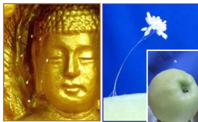
左：韩国须弥山禅院佛像上的婆罗花。右：纽约苹果上的婆罗花。

最近，传说三千年一开的优昙婆罗花再次出现在美国纽约上州。神奇小白花盛开在一个从果园摘的苹果上。