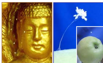
左：韩国须弥山禅院佛像上的婆罗花。右：纽约苹果上的婆罗花。

最近，传说三千年一开的优昙婆罗花再次出现在美国纽约上州。神奇小白花盛开在一个从果园摘的苹果上。