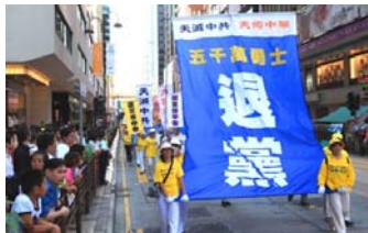
香港声援“三退”大游行

这名警察明白真相后，在自己的职权范围内，多次保护法轮功学员。一名法轮功学员被绑架到派出所后，她亲自给派出所所长打电话，当天晚上这名法轮功学员就被释放了。