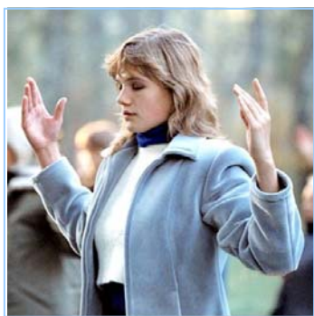
俄罗斯法轮功学员炼功

● 法轮功教人向善 法轮功是佛家修炼大法，以真、善、忍为修炼原则。修炼人从做好人做起，努力按照真、善、忍标准提升个人心性，返本归真；还包含五套缓慢优美的功法动作。法轮大法教人向善。修炼法轮功不但能祛病健身，使人变得诚实、善良、宽容、和平，而且能开启智慧，逐渐达到洞悉人生和宇宙奥秘的自在境界。