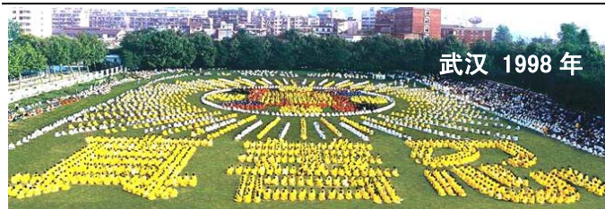
武汉 1998 年