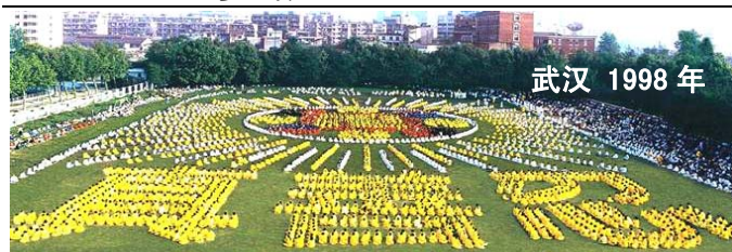
武汉 1998 年

二零零九年九月二十六日晚，亚太人权基金会“人权领袖奖”颁奖典礼在美国洛杉矶鲍温公园市隆重举行，当主持人宣布今年的特殊奖项“杰出精神领袖奖”由法轮功创始人李洪志先生