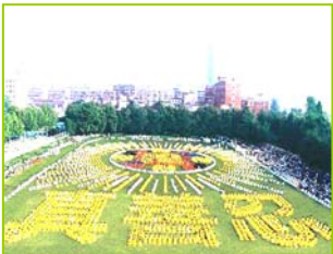
1997年武汉五千多法轮功学员炼功，排法轮图形和“真善忍”字样

1999年7月20日，中共发动了对法轮功的全面迫害，引发全球法轮功学员反迫害、讲真相活动。◇