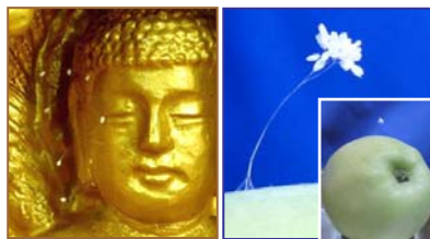
左：韩国须弥山禅院佛像上的婆罗花。右：纽约苹果上的婆罗花。

最近，传说三千年一开的优昙婆罗花再次出现在美国纽约上州。神奇小白花盛开在一个从果园摘的苹果上。