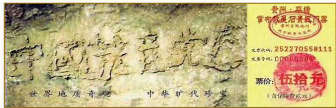
■贵州省平塘县风景区内的“藏字石”，距今2.7亿年，石头断面上天然形成六个大字：中国共产党亡。