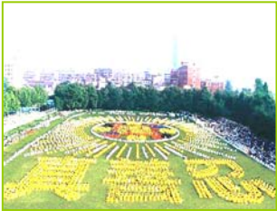
1997年武汉五千多法轮功学员炼功，排法轮图形和“真善忍”字样

1999年7月20日，中共发动了对法轮功的全面迫害，引发全球法轮功学员反迫害、讲真相活动。◇