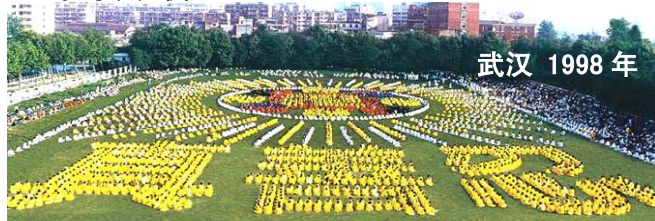
武汉 1998 年

法轮功已弘传世界 114 个国家和地区，受到世界人民的爱戴和尊敬。因李洪志先生和法轮大法对人类身心健康作出的杰出贡献，已获得各国政府褒奖、支持议案信函 3000 多项。法轮功书籍被译成 30 多种语言，在全世界出版发行，并可从网上免费下载。