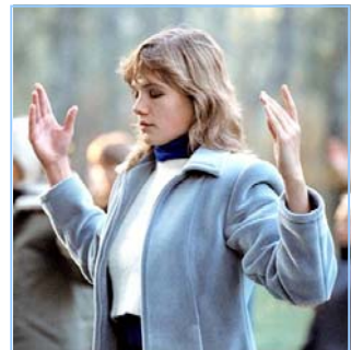
俄罗斯法轮功学员炼功

法轮功是佛家修炼大法，以真、善、忍为修炼原则。修炼人从做好人做起，努力按照真、善、忍标准提升个人心性，返本归真；还包含五套缓慢优美的功法动作。法轮大法教人向善。修炼法轮功不但能祛病健身，使人变得诚实、善良、宽容、和平，而且能开启智慧，逐渐达到洞悉人生和宇宙奥秘的自在境界。