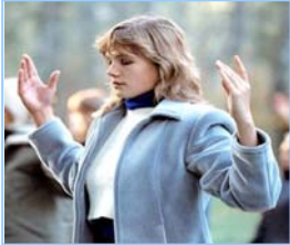
俄罗斯法轮功学员

返本归真；还包含五套缓慢优美的功法动作。法轮大法教人向善。修炼法轮功不但能祛病健身，使人变得诚实、善良、宽容、和平，而且能开启智慧，逐渐达到洞悉人生和宇宙奥秘的自在境界。