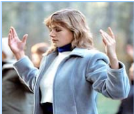
俄罗斯法轮功学员

返本归真；还包含五套缓慢优美的功法动作。法轮大法教人向善。修炼法轮功不但能祛病健身，使人变得诚实、善良、宽容、和平，而且能开启智慧，逐渐达到洞悉人生和宇宙奥秘的自在境界。