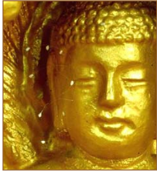
上图: 纽约上州, 苹果上的优昙婆罗花。 下图: 韩国须弥山禅院佛像上的婆罗花。

一九九七年, 韩国媒体首次报导了清溪寺出现优昙婆罗花, 后来韩国又相继报导了许多地方有此奇花开放, 引起众多信佛人的惊喜。婆罗花此后又相继在中国大陆多