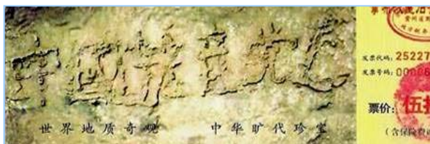
■ 2002 年在贵州平塘县掌布乡发现的藏字石，石头断面上天然形成六个字：中国共产党亡，昭示着“天灭中共”的天意。图为风景区门票。

今年夏天，小敏丈夫在去邓县的路上，出了车祸，造成头部重伤，整天躺在床上不睁眼，大小便靠人料理。小敏听说有个乡也有个植物人，好了，能走路，赶紧去打听情况，原来是诚心相信“法轮大法好”好的。