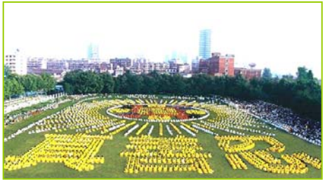
1997年武汉五千多法轮功学员炼功，排组法轮图形和“真善忍”字样

背景资料： 法轮大法，是由李洪志先生于1992年5月传出的佛家上乘修炼大法，以“真善忍”为根本指导，按照宇宙演化原理而修炼。经