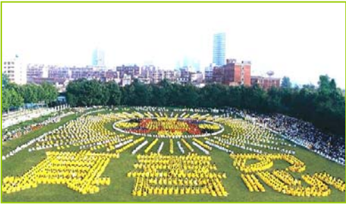
1997年武汉五千多法轮功学员炼功，排组法轮图形和“真善忍”字样

1999年7月20日，中共发动了对法轮功的全面迫害，引发全球法轮功学员反迫害、讲真相活动。◇