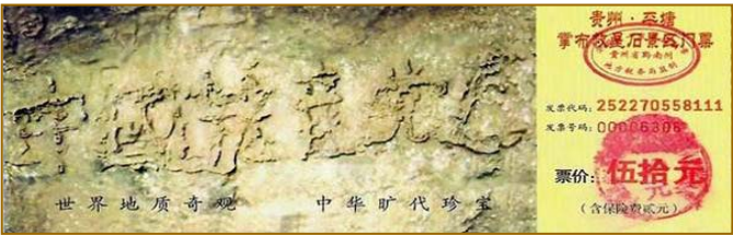
■贵州省平塘县风景区内的“藏字石”，距今2.7亿年，石头断面上天然形成六个大字：中国共产党亡。

联合国会议上，就天安门自焚事件，强烈谴责中共的“国家恐怖主义行为”。声明说：从录像分析表明，整个事件是“政府一手导演的”。中国代表团面对确凿的证据，没有辩辞。该声明已被联合国备案。