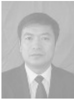
县委常委 政法委员 李平