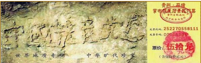
■贵州省平塘县风景区内的“藏字石”，距今2.7亿年，石头断面上天然形成六个大字：中国共产党亡。