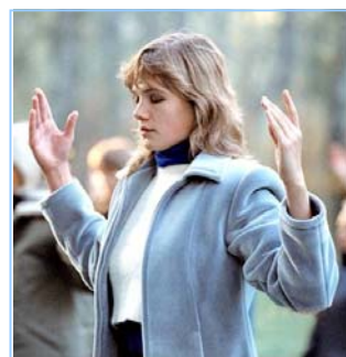
俄罗斯法轮功学员炼功

法，以真、善、忍为修炼原则。修炼人从做好人做起，努力按照真、善、忍标准提升个人心性，返本归真；还包含五套缓慢优美的功法动作。法轮大法教人向善。修炼法轮功不但能祛病健身，使人变得诚实、善良、宽容、和平，而且能开启智慧，逐渐达到洞悉人生和宇宙奥秘的自在境界。