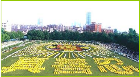
1997年武汉五千多法轮功学员炼功，排组法轮图形和“真善忍”字样

背景资料: 法轮大法，是由李洪志先生于1992年5月传出的佛家上乘修炼大法，以“真善忍”为根本指导，按照宇宙演化原