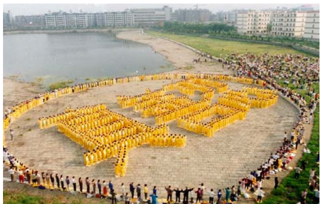
法轮功九二年传出，因其教人向善，使人健康，福益社会，短短七年时间吸引了上亿修炼者。图为九八年武汉法轮功学员集体炼功排字。

到今天已三个多月了，我像变了个人，能做家务了，上街，串门，爱去哪就去哪，街上碰到熟人，我跟他们说：是炼法轮功救了我。我还找到一起皈依佛教的同伴，讲亲身经历的大法神奇，她们也都很感兴趣。