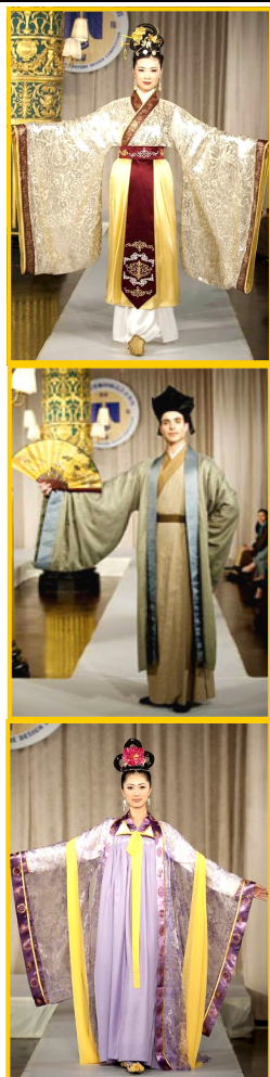
银奖 溯源·古风 (美国) 陈颖 金奖 行云流水汉古风 (美国) 程铭华 铜奖 古道清风 (台湾) 蔡美云