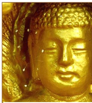
图：韩国须弥山禅院佛像上的优昙婆罗花。

1997年，韩国媒体首次报导了清溪寺出现优昙婆罗花，后来韩国媒体又相继报导了许多地方有奇花开放，引起佛教界的惊喜。接着在大陆许多地区陆续传出了优昙婆罗花开放的消息，并有很多见诸媒体报导。这种奇花也在台湾、香港、马来西亚、新加坡、澳洲、美国等世界各地处处绽放。这些事实明白的晓谕世人，佛经中传说的三千年才盛开的奇花优昙婆罗确实降临了人间。佛经中是这么说的：优昙婆罗花三千年一开，花开之时为转轮圣王下世正法度人之时。《慧琳音义》卷八载：“优昙婆罗