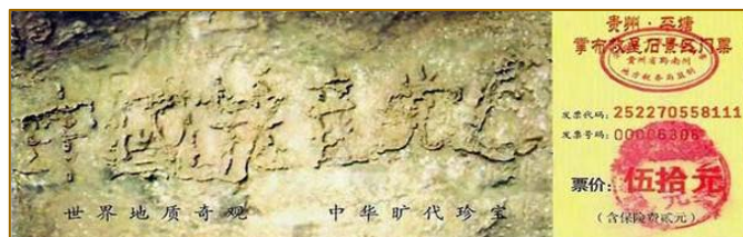
■贵州省平塘县风景区内的“藏字石”，距今 2.7 亿年，石头断面上天然形成六个大字：中国共产党亡。

人类的历史也告诉我们：迫害正义的从来没有成功过。古罗马帝国在一千多年前残酷镇压基督信徒，但是不仅没有灭掉基督信徒们的信仰，反而使基督教传遍全世界。古罗马帝国却因此遭到了上天的惩罚，在发生了四次大瘟疫（鼠疫、伤寒等）后灭亡了！