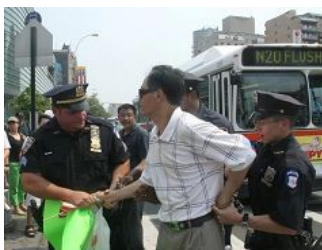
美国警察逮捕谩骂法轮功学员的中共暴徒。

美国 零八年五至六月，在中共政法委书记周永康的策划下，中共从国内到海外配合式构陷法轮功，继续制造谎言煽动中国民众和海外华人对法轮功的仇恨。在中领馆的幕后组织下，五月十七日，暴徒大