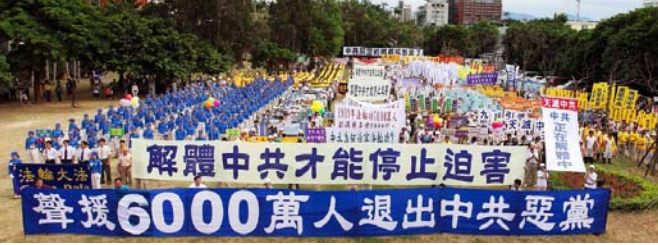
■ 2009年9月27日，台湾法轮功学员在新竹市举办“声援六千万勇士退出中共”集会大游行。

比起过去，现在大陆游客更愿意接受真相资料，很多人还会主动和学员合影，并欣然悄悄三退。有时甚至整团整团地退，目前在台湾旅游点三退的人数已经相当可观。◇