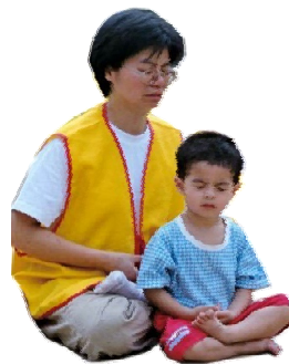
余女士和儿子在炼功

曾经一身病痛、脾气暴躁的余女士，修炼法轮功后如获新生，朋友目睹她的转变后说：“真的假不了啊，你的脸颊红润充满朝气，脾气温和，整个人让人觉得非常的祥和、亲切！法轮功真的让人向往啊！”