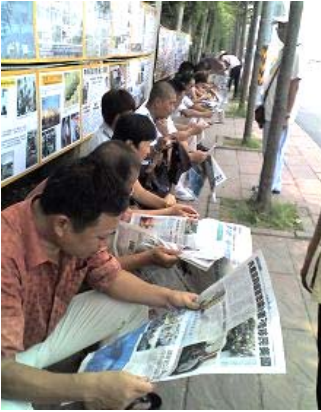
■在台湾景点高雄西子湾的真相看板前，成列的大陆游客专注翻阅讲述真相的大纪元时报。

从大陆来台湾观光的民众，抵达台湾桃园中正国际机场大厅时，迎面而来的首先是笑容可掬的法轮功学员，他们手拿真相展板，亲切地说着：“欢迎你们来台湾旅游观光！希望你们记住‘法轮