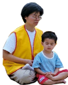
余女士和儿子在炼功

曾经一身病痛、脾气暴躁的余女士，修炼法轮功后如获新生，朋友目睹她的转变后说：“真的假不了啊，你的脸颊红润充满朝气，脾气温和，整个人让人觉得非常的祥和、亲切！法轮功真的让人向往啊！”