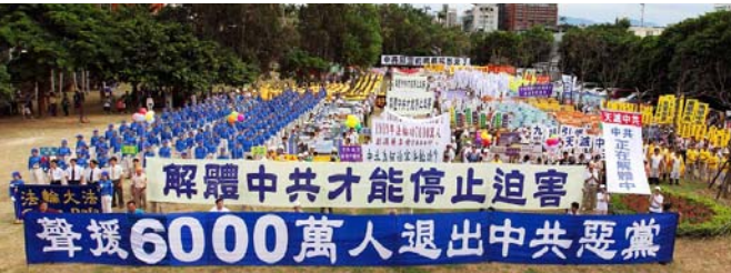
■ 2009年9月27日，台湾法轮功学员在新竹市举办“声援六千万勇士退出中共”集会大游行。

比起过去，现在大陆游客更愿意接受真相资料，很多人还会主动和学员合影，并欣然悄悄三退。有时甚至整团整团地退，目前在台湾旅游点三退的人数已经相当可观。◇