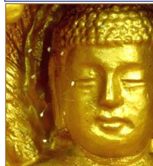
上图：美国纽约，苹果上的优昙婆罗花。