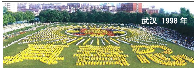
武汉 1998 年