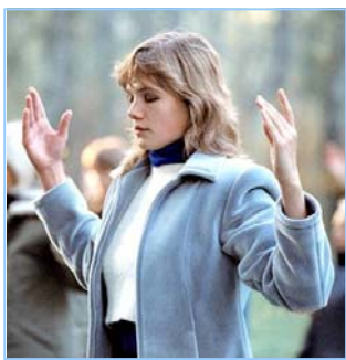
俄罗斯法轮功学员炼功

● 法轮功教人向善 法轮功是佛家修炼大法，以真、善、忍为修炼原则。修炼人从做好人做起，努力按照真、善、忍标准提升个人心性，返本归真；还包含五套缓慢优美的功法动作。法轮大法教人向善。修炼法轮功不但能祛病健身，使人变得诚实、善良、宽容、和平，而且能开启智慧，逐渐达到洞悉人生和宇宙奥秘的自在境界。