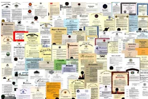
■ 法轮大法获各国政府褒奖、支持议案信函超过 3000 项