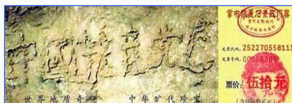
■贵州平塘县掌布风景区的“藏字石”，被中科院地质专家鉴定石头断面上天然形成六个字——中国共产党亡。