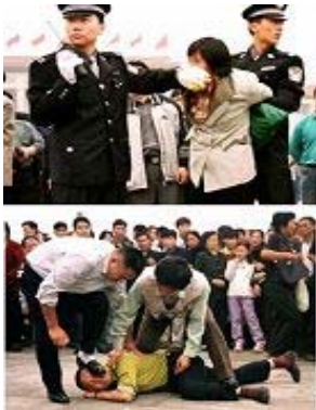
警察在天安门广场上殴打抓捕法轮功学员。

“那是我第一次亲眼看到法轮功。那时，我跟我的父亲到大陆去旅游。在天安门广场，我们看到有很多人坐在地上打坐，旁边有很多人围观，我们就过去看发生什么事；结果，看到警察对那些打坐的人拳打脚踢，他们没有还手，但警察还用棒子狠命打他们；还有妇女带着小朋友的也被打得很惨。”“当时我觉得很吃惊，怎么会这样子？我就