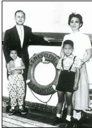
钱学森一家四口（摄于 1955 年）

早在 1982 年，钱学森就给中宣部副部长郁文写信表示：“保证人体特异功能是真的，不是假