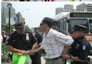
美国警察逮捕谩骂法轮功学员的中共暴徒。