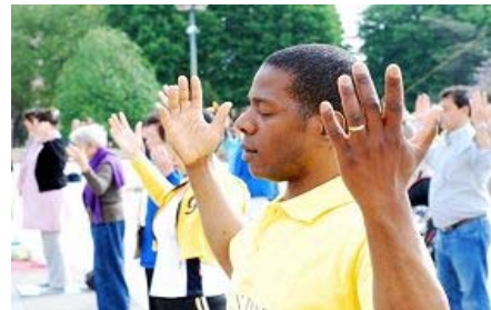
■“真善忍”的巨大威德和感召力超越国界，受到各族裔的珍视。图为今年五月法国法轮功学员在庆祝活动中集体炼功。

全世界大法弟子和善良的民众在每年的这一天举行各种庆典，分享大法带给生命的希望与美好。