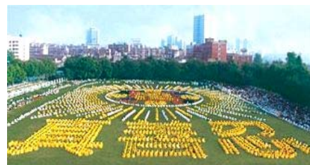
■一九九八年，武汉，五千多名法轮功学员集体炼功。