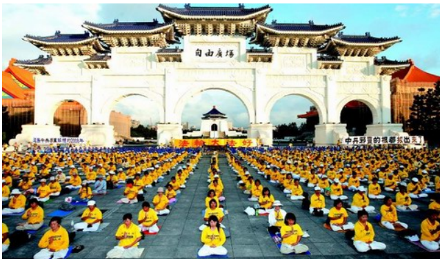
二零零八年十一月四日，三千多名台湾法轮功学员在台北自由广场前炼功，抗议中共迫害法轮功。

多种语言文字在世界各地出版发行；荣获海外各国政府及各界三千多项褒奖与支持议案信函；法轮大法是利国利民的、超越民族和国家的高德大法！