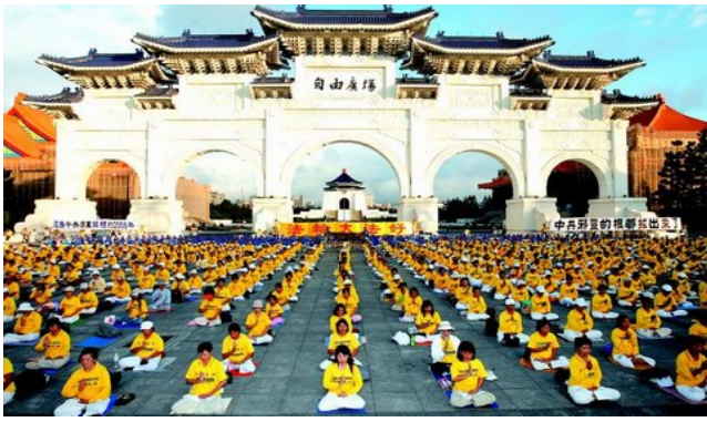
二零零八年十一月四日，三千多名台湾法轮功学员在台北自由广场前炼功，抗议中共迫害法轮功。

多种语言文字在世界各地出版发行；荣获海外各国政府及各界三千多项褒奖与支持议案信函；法轮大法是利国利民的、超越民族和国家的高德大法！