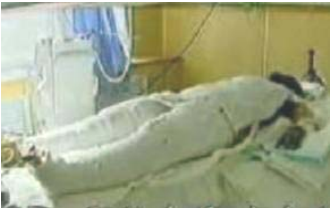
央视《焦点访谈》中的“自焚者”被包裹得严密。