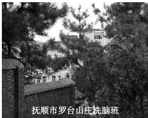
抚顺市罗台山庄洗脑班

第二个阶段是以邪说来破坏大法弟子的正信。利用各种洗脑和一帮邪悟者不分昼夜的围攻大法弟子，故意断章取义、歪曲大法法理。同时又弄来一帮子所谓“专家、学者”从所谓的法律、宗教、心理学、邪党党史等方面直接或间接地影射、污蔑、诽谤大法，并强迫所有人观看污蔑法轮功的录像，以达到其“转化”目的。