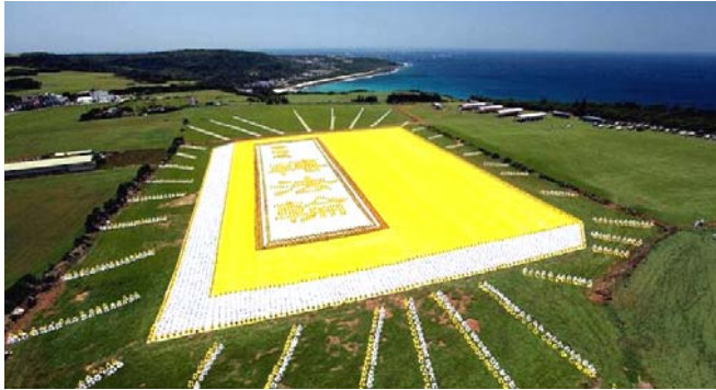
■ 2009年5月9日，6000多名台湾法轮功学员集体炼功，排演《转法轮》一书，贺大法传世十七周年。

● 弘传世界 各国褒奖 法轮功已弘传世界114个国家和地区，受到世界人民的爱戴和尊敬，获得各国政府褒奖、支持议案信函3000多项。法轮功书籍被译成30多种语言，在全世界出版发行，并可从网上免费下载。