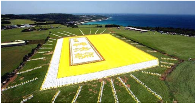
2009 年 5 月 9 日，6000 多名台湾法轮功学员集体炼功，排演《转法轮》一书，贺大法传世十七周年。

● 弘传世界 各国褒奖 法轮功已弘传世界 114 个国家和地区，受到世界人民的爱戴和尊敬，获得各国政府褒奖、支持议案信函 3000 多项。法轮功书籍被译成 30 多种语言，在全世界出版发行，并可从网上免费下载。