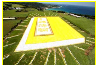
五月九日，台湾六千多名法轮功学员排演《转法轮》一书。

老百姓应该看明白，谁才是真对自己好。在法轮功问题上，请您多了解真相，不要被中共欺骗。◇