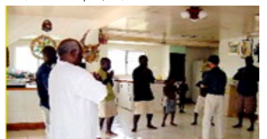
图为南太平洋岛国——巴布亚新几内亚前副总理及家人学炼法轮功