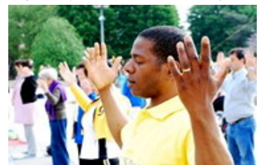
图为今年五月法国法轮功学员在庆祝活动中集体炼功。