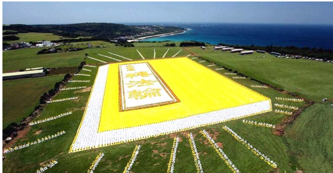
■2009年5月9日，6000多名台湾法轮功学员集体炼功，排演《转法轮》一书，贺大法传世十七周年。

● 弘传世界 各国褒奖 法轮功已弘传世界114个国家和地区，受到世界人民的爱戴和尊敬，获得各国政府褒奖、支持议案信函3000多项。法轮功书籍被译成30多种语言，在全世界出版发行，并可从网上免费下载。