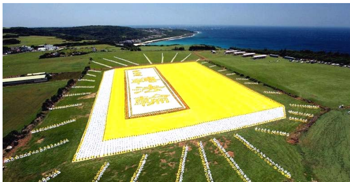
■2009年5月9日，6000多名台湾法轮功学员集体炼功，排演《转法轮》一书，贺大法传世十七周年。

● 弘传世界 各国褒奖 法轮功已弘传世界114个国家和地区，受到世界人民的爱戴和尊敬，获得各国政府褒奖、支持议案信函3000多项。法轮功书籍被译成30多种语言，在全世界出版发行，并可从网上免费下载。