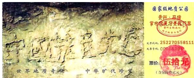
图为藏字石风景区门票：“中国共产党亡”清晰可见

接着他看了其它相关的真相资料。他从心里明白了我的好意。他说：“我服你了，就给我退了那个邪党吧！”