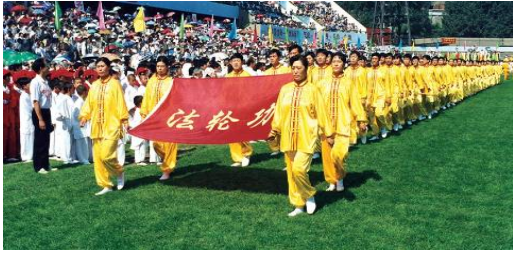
1998年法轮功学员在亚洲体育节开幕式上

“真善忍”，不听从它们的“假恶斗”。于是，利用手中的权力，置宪法与法律于不顾，对法轮功进行野蛮的残酷镇压。