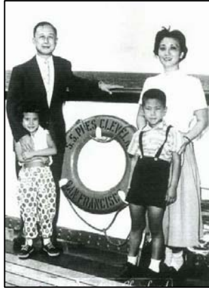
钱学森一家四口（摄于1955年）

早在1982年，钱学森就给中宣部副部长郁文写信表示：“保证人体特异功能是真的，不是假