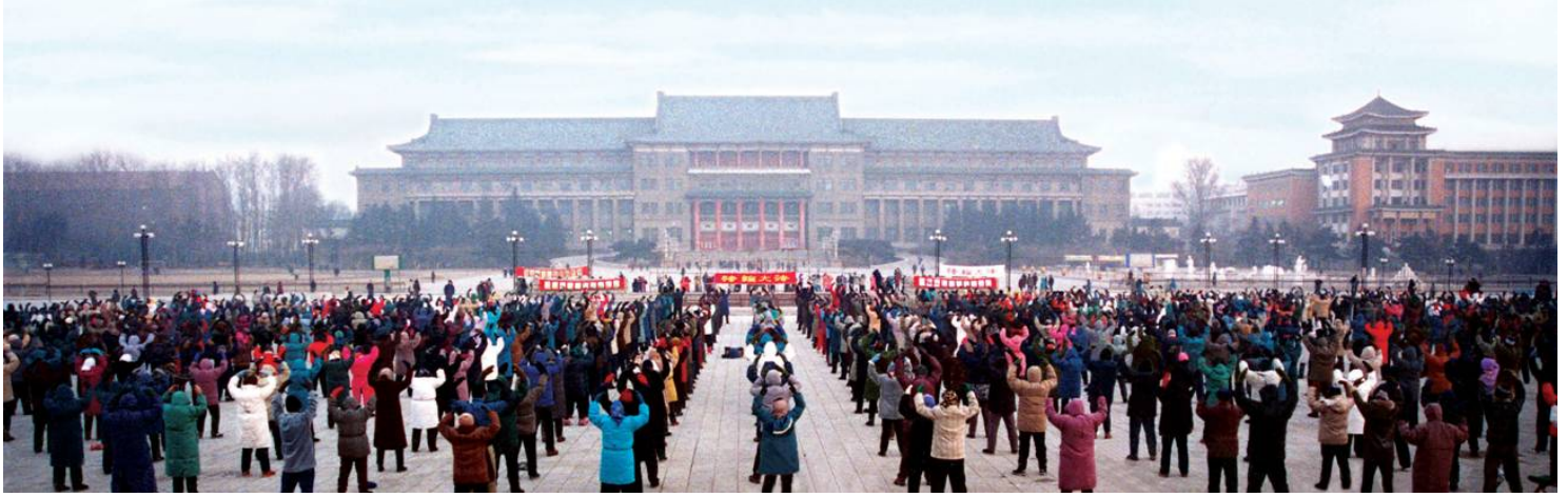
■一九九八年一月一日，吉林省长春市地质宫门前两千多人晨炼的壮观情景。