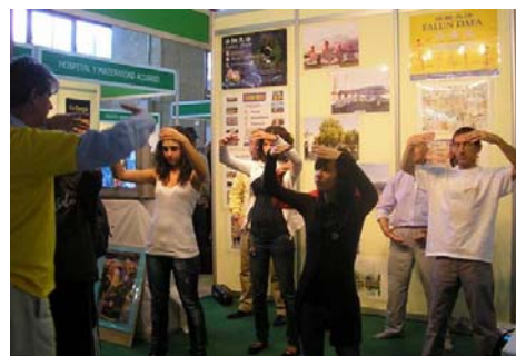
■ 参观者当场学炼法轮功功法

参展的另一展位的女士听了法轮大法介绍会。第二天，她到法轮大法展位前高兴地对学员说：“法轮大法非常好！”她告诉学员：“展会开始前一天，我的胳膊突然很痛，痛得抬不起来，我很着急，不知如何度过这四天的展会工作。没想到昨天参加介绍会，又学了第一套功法后，我发现原本痛得很厉害的胳膊竟神奇地好了！”