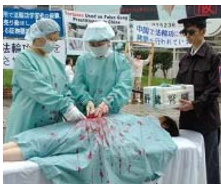
日本法轮功学员曝光中共活摘器官罪行。

加拿大著名人权律师大卫·麦塔斯和加拿大前外交部亚太司司长大卫·乔高，于 2006 年 7 月公布了“中共活体摘取法轮功学员器官”的独立调查报告，后在联合国发表。他们收集了