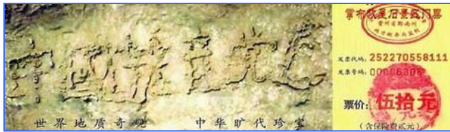
■贵州平塘县掌布风景区的“藏字石”，被中科院地质专家鉴定为五百年前从崖壁落下一分为二，石头断面上天然形成六个字——中国共产党亡，昭示着天灭中共的天象。

父亲知道后有些意外，没想到老上司这么容易就退了。看来中共内部的很多高层干部，都明白中共长不了了，都人心思退党呢。