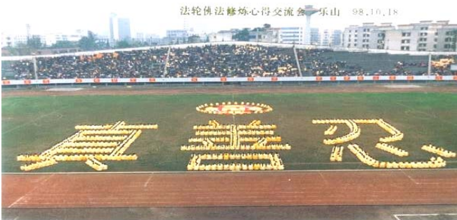
99 年中共迫害法轮功前，乐山市法轮功学员排字炼功。

法轮功传遍世界 目前，法轮大法已弘传世界 110 多个国家和地区，在全世界范围内都得到了好评。已获得各国政府褒奖、支持议案信函 3000 多项。法轮功的主要书籍《转法轮》已翻译成 30 多种文字，成为世界上流行最广的书籍之一，在全世界出版发行，并可从网上免费下载。