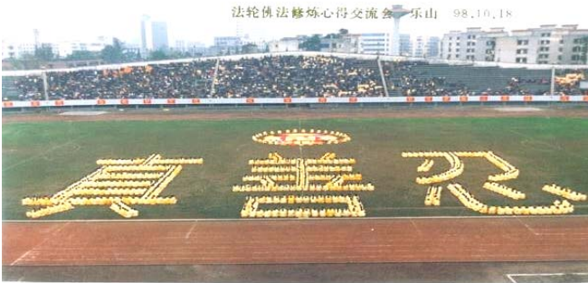
99 年中共迫害法轮功前，乐山市法轮功学员排字炼功。

法轮功传遍世界 目前，法轮大法已弘传世界 110 多个国家和地区，在全世界范围内都得到了好评。已获得各国政府褒奖、支持议案信函 3000 多项。法轮功的主要书籍《转法轮》已翻译成 30 多种文字，成为世界上流行最广的书籍之一，在全世界出版发行，并可从网上免费下载。