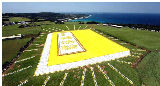
■2009 年 5 月 9 日，6000 多名台湾法轮功学员集体炼功，排演《转法轮》一书，贺大法传世十七周年。

后来，这位大妈去世了，一天后她又活了过来，她说：“我确实到了阎王那里，阎王说：你是看了宝书的人，我们这里不敢收你，你还是回去吧。我就回来了。”她的家人都很惊喜，又很好奇，因她从来不读书，便问她看了什么宝书？