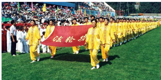
1998年法轮功学员在亚洲体育节开幕式上

“真善忍”，不听从它们的“假恶斗”。于是，利用手中的权力，置宪法与法律于不顾，对法轮功进行野蛮的残酷镇压。