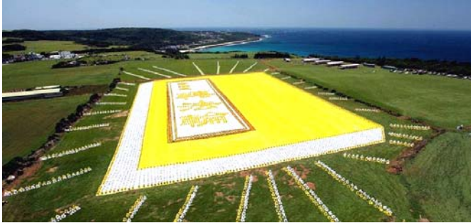
2009年5月9日，6000多名台湾法轮功学员集体炼功，排演《转法轮》一书，贺大法传世十七周年。

● 弘传世界 各国褒奖 法轮功已弘传世界114个国家和地区，受到世界人民的爱戴和尊敬，获得各国政府褒奖、支持议案信函3000多项。法轮功书籍被译成30多种语言，在全世界出版发行，并可从网上免费下载。