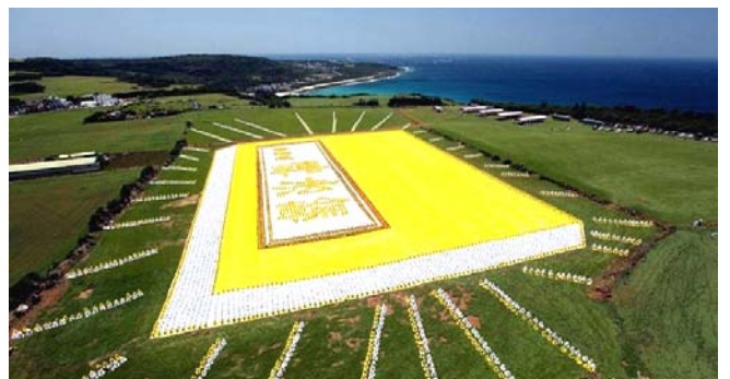
■2009年5月9日，6000多名台湾法轮功学员集体炼功，排演《转法轮》一书，贺大法传世十七周年。

● 弘传世界 各国褒奖 法轮功已弘传世界114个国家和地区，受到世界人民的爱戴和尊敬，获得各国政府褒奖、支持议案信函3000多项。法轮功书籍被译成30多种语言，在全世界出版发行，并可从网上免费下载。