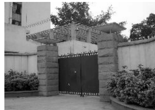
左图为新津洗脑班大门。（此门平时长期关闭，只是在有难得的车辆进出和此中心工作人员进出时，才会开那么一瞬。）

同时，还可以对被洗脑者榨取钱财，因为洗脑班每“转化”（强迫放弃信仰）一个法轮功学员，就可得到一笔可观的奖金。像是新津洗脑班从二零零三年四月非法成立到零五年底，榨取法轮功学员所在单位的钱财初步估计已超过二百万元。