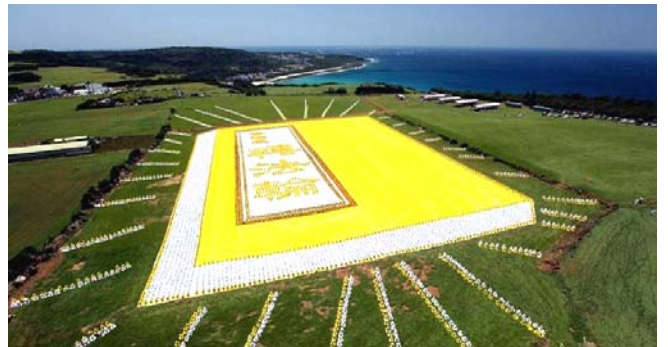
■2009年5月9日，6000多名台湾法轮功学员集体炼功，排演《转法轮》一书，贺大法传世十七周年。

● 弘传世界 各国褒奖 法轮功已弘传世界114个国家和地区，受到世界人民的爱戴和尊敬，获得各国政府褒奖、支持议案信函3000多项。法轮功书籍被译成30多种语言，在全世界出版发行，并可从网上免费下载。