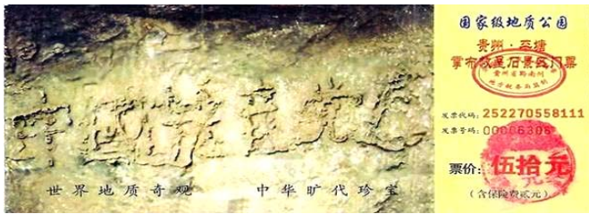
귀주성 평당현 장포향풍경구 문표

그후로부터 그는 날마다 성심성의로 “파룬따파는 좋다, 찐,싼,런은 좋다”를 읽으면서 찐,싼,런에 따라 자신을 요구하고 좋은 사람이 되려 하였다. 지금까지 반년이 지났으나 한번도 병이 도지지 않았다. 지금 그의 아들 딸들도 대법이 좋다는 것을 진심으로 믿으며 사당과 관련된 조직에서도 탈출하였다. (문/정주(郑州)파룬궁학원)