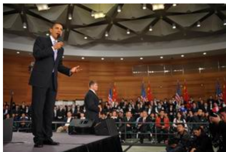
■ 奥巴马 16 日在上海一个美国式的镇民大会中与被安排的“学生”对话

美联社说：美国总统奥巴马在中国就言论自由和网络审查“将”了中共一军，可惜大多数中国民众看不到，因为他的话在网络上遭到封锁，而且只有一个地方电视转播。