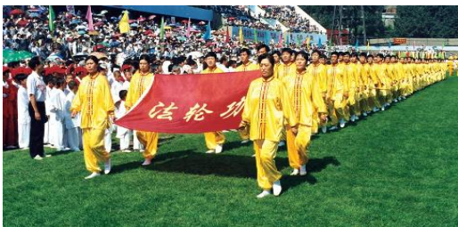
1998年法轮功学员在亚洲体育节开幕式上