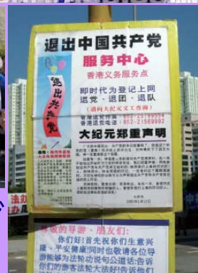
香港一旅游景点 退党服务中心