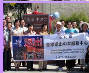
▲ 洛杉矶退党服务中心